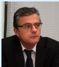
Ανδρέας Ι.Ποττάκης Συνήγορος του Πολίτη